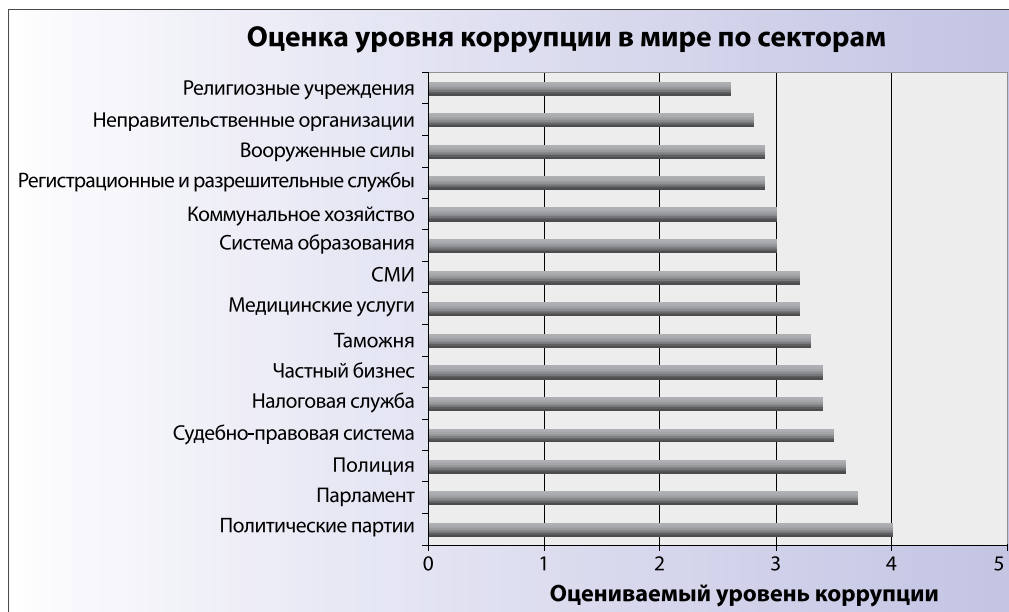
Рис. 14.1: Доверие к вооруженным силам в сравнении с другими социальными институтами

ношение к военным, наблюдаются существенные отличия между отдельными странами. На Рис. 14.2 отражены результаты исследования “Глобальный Барометр Коррупции” за 2006 и 2007 годы в части, касающейся военных. 9